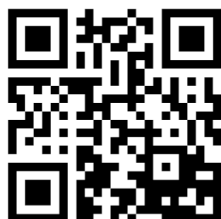
VIDEO RESTAURI 2017

Ad oggi i quadri restaurati, grazie alla generosità di alcuni parrocchiani sono 9. Siamo in attesa di altri offerenti per i rimanenti quadri. Grazie !